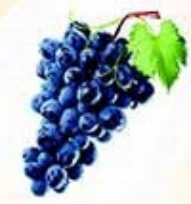
Гроздобер в Южен Сакар

9 - 10 септември 2017 г., Харманли, парк "Димана Данева"